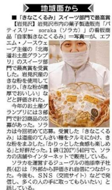
北海道新聞 (2023年9月7日 (木) 札幌版 & web掲載)