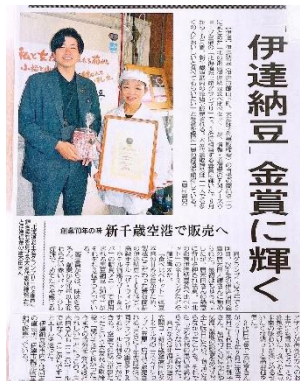
室蘭民報 (2023年7月13日 (木) 誌面& web掲載)